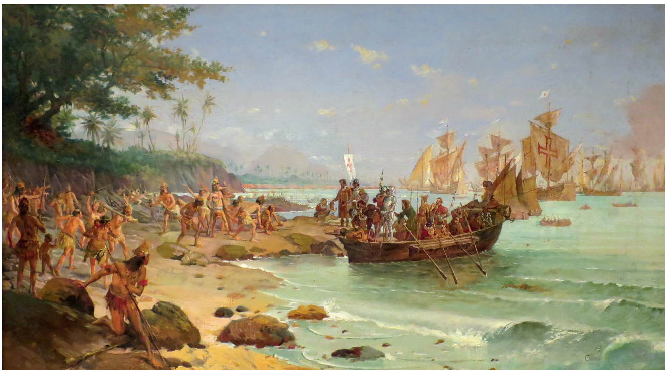
Desembarque de Cabral em Porto Seguro. Óleo sobre tela, de Oscar Pereira da Silva, de 1904 (acervo do Museu Histórico Nacional, Rio de Janeiro).