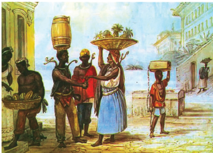
O Rio de Janeiro, pelas aquarelas e pinturas do artista francês Jean-Baptiste Debret.

A coleção A formação do povo brasileiro , oferece recursos aos professores para trabalharem a temática nas áreas de Educação Artística, Literatura e História, bem como, resgata para debates fatos importantes, como por exemplo: os colonizadores não “descobriram” uma nova terra, e sim, a encontraram, pois por aqui viviam, no ano de 1500, milhares de seres humanos habitando esse território há mais de 11 mil anos, e assim também conta a dura história de resistência dos africanos à escravidão, bem como os seus diversos movimentos e os quase 100 anos de existência e resistência do Quilombo dos Palmares.